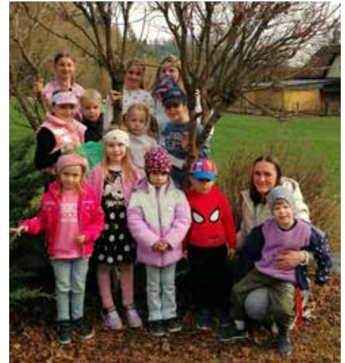
Frühjahrsputz 2026 - Wir waren dabei!